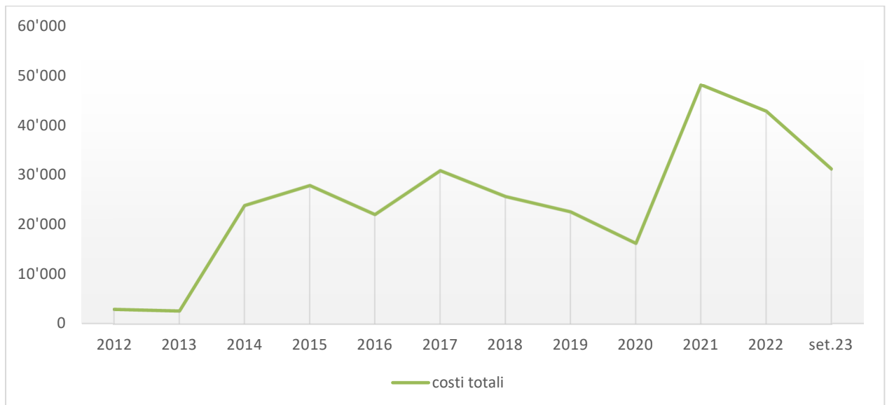
Figura 2-3 – evoluzione misure di protezione periodo 2012-settembre 2023 4