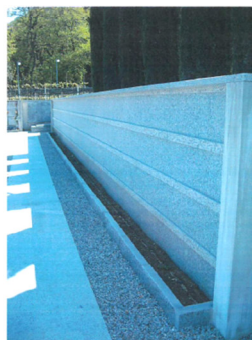
Rivestimento in pietra naturale