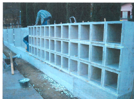
Moduli loculi prefabbricati