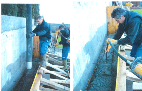
Fondazioni calcestruzzo armato