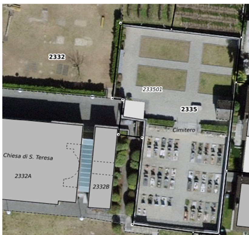
Fotografia aerea con indicazione loculi esistenti

Durante la fase di spurgo del cimitero, avvenuto nell'anno 2010, è stato realizzato un manufatto per 30 loculi cinerari, in aggiunta ai 36 esistenti ubicati ai lati della scala che collega le due aree di sepoltura.