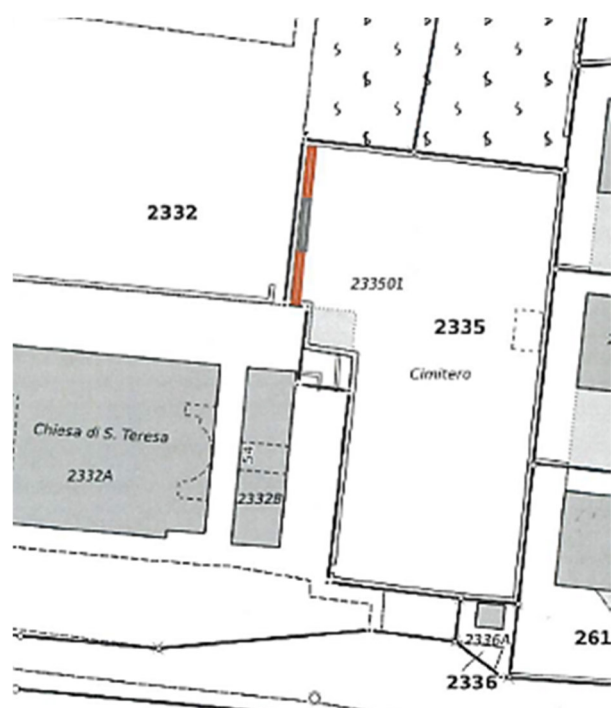
Planimetria con indicazione ampliamento in rosso