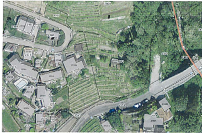
- estratto ortofoto SIFTI -