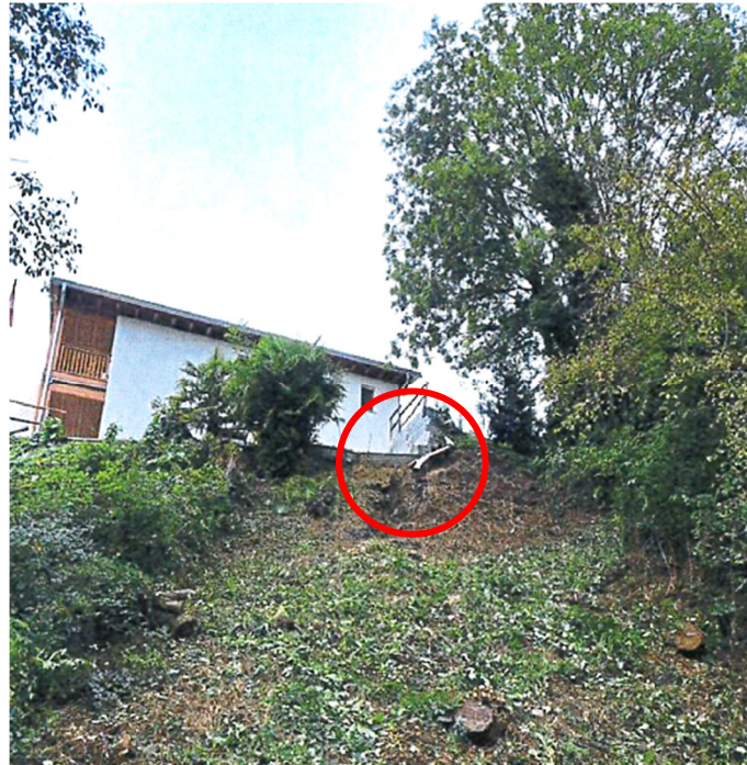
Fotografia situazione esistente, con condotta comunale interrotta sul mappale privato 2551 RFD

Tale prolungo è stato approvato dalla SPAAS.