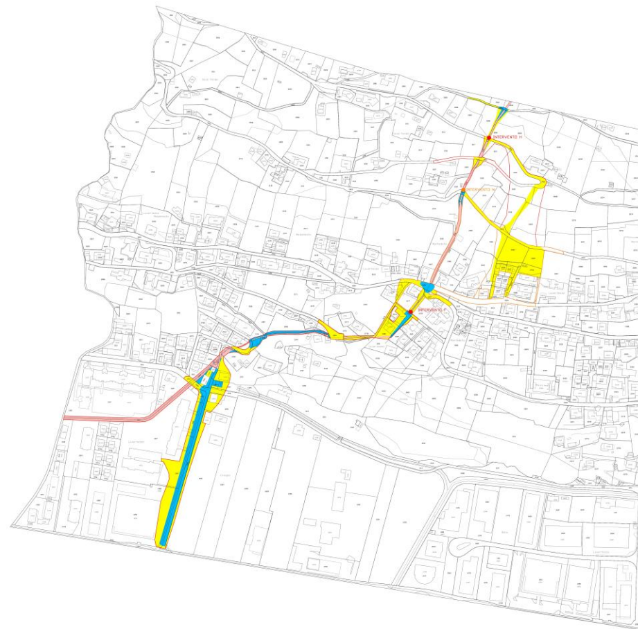
SITUAZIONE DOPO GLI INTERVENTI DI RIPRISTINO DEL RIALE VALEGIA