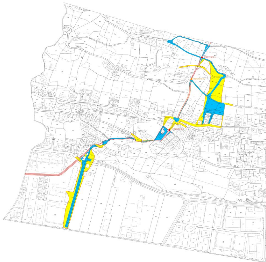
SITUAZIONE PRIMA DEGLI INTERVENTI DI RIPRISTINO DEL RIALE VALEGIA