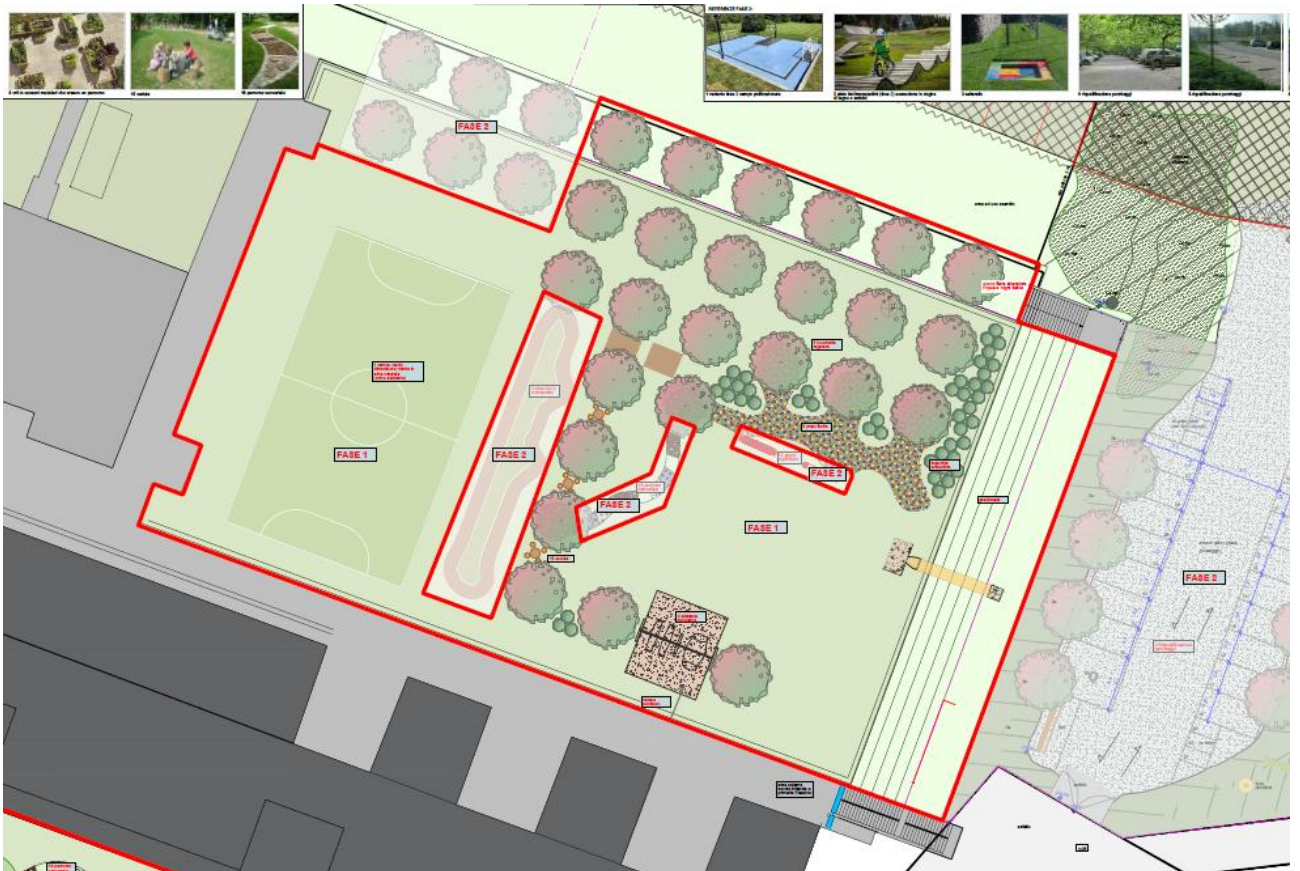
Boschetto Fase 1

L'area sarà arricchita da giochi, arredi e cartellonistica dove si spiega agli alunni l'importanza della biodiversità vegetale e animale, con l'obiettivo di alternare momenti di svago e di apprendimento all'aria aperta.