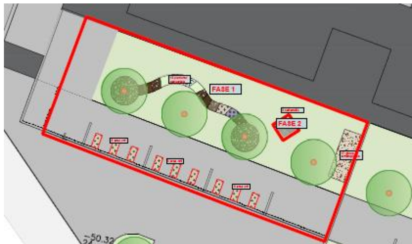
Orti e percorso sensoriale Fase 1

Ogni classe ha a disposizione un'area orto assegnata dove i bambini e gli insegnanti possono sperimentare e imparare i processi naturali dell'orticoltura.