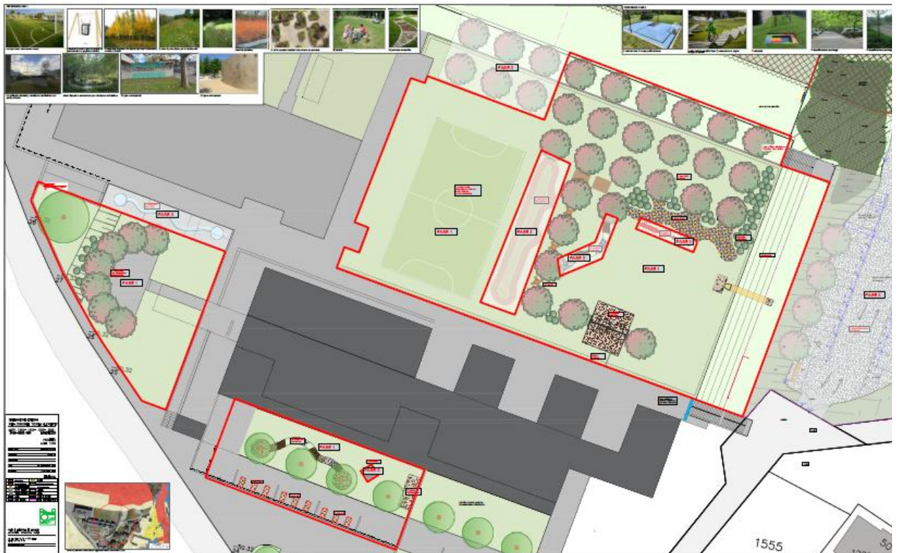
Planimetria generale progetto luglio 2025