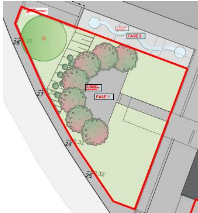
Anfiteatro verde Fase 1