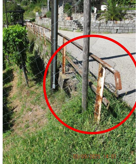
scoscendimento muro di sostegno

Oltre alla sistemazione del muro, si prevede: la messa a norma della barriera stradale con la sua sostituzione e la creazione di un nuovo cordolo in calcestruzzo, il rifacimento della pavimentazione stradale a ridosso del nuovo cordolo/barriera ed il potenziamento dello smaltimento delle acque meteoriche.