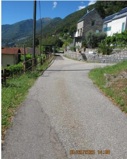
vista generale stato di fatto