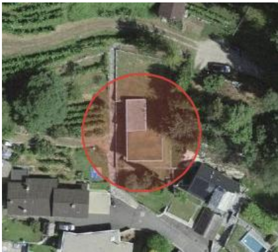
Fotografia aerea stato di fatto

Non sono stati, sino ad oggi, eseguiti lavori di manutenzione straordinaria.