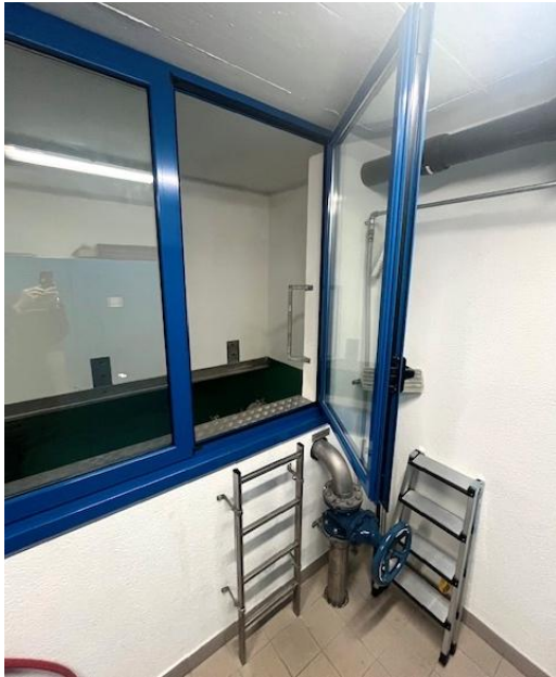
Accesso alle vasche stato di fatto

Saranno valutati ulteriori aspetti, quali una nuova disposizione delle armature idrauliche e la necessità di un sistema di antintrusione al serbatoio.