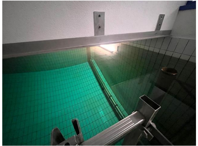
Rivestimento delle vasche stato di fatto