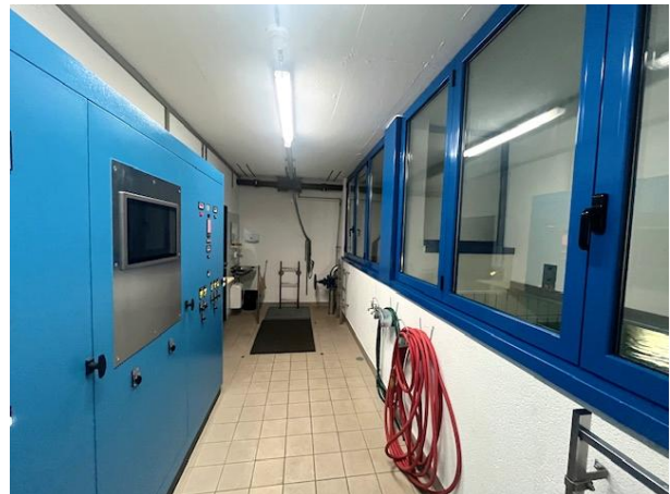
Viste interne stato di fatto