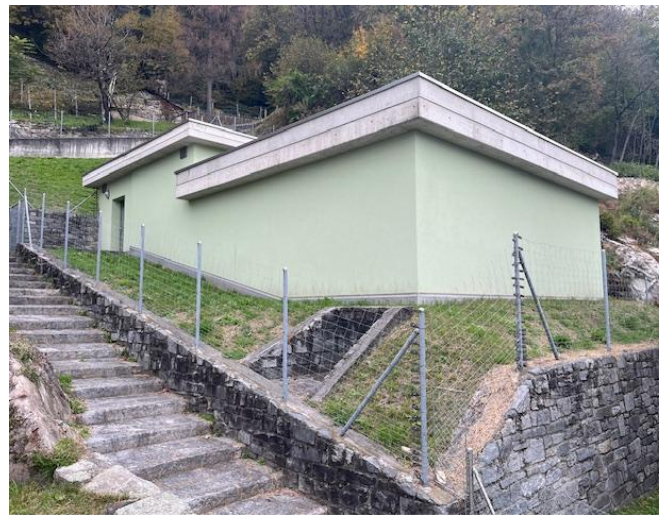
Vista esterna stato di fatto