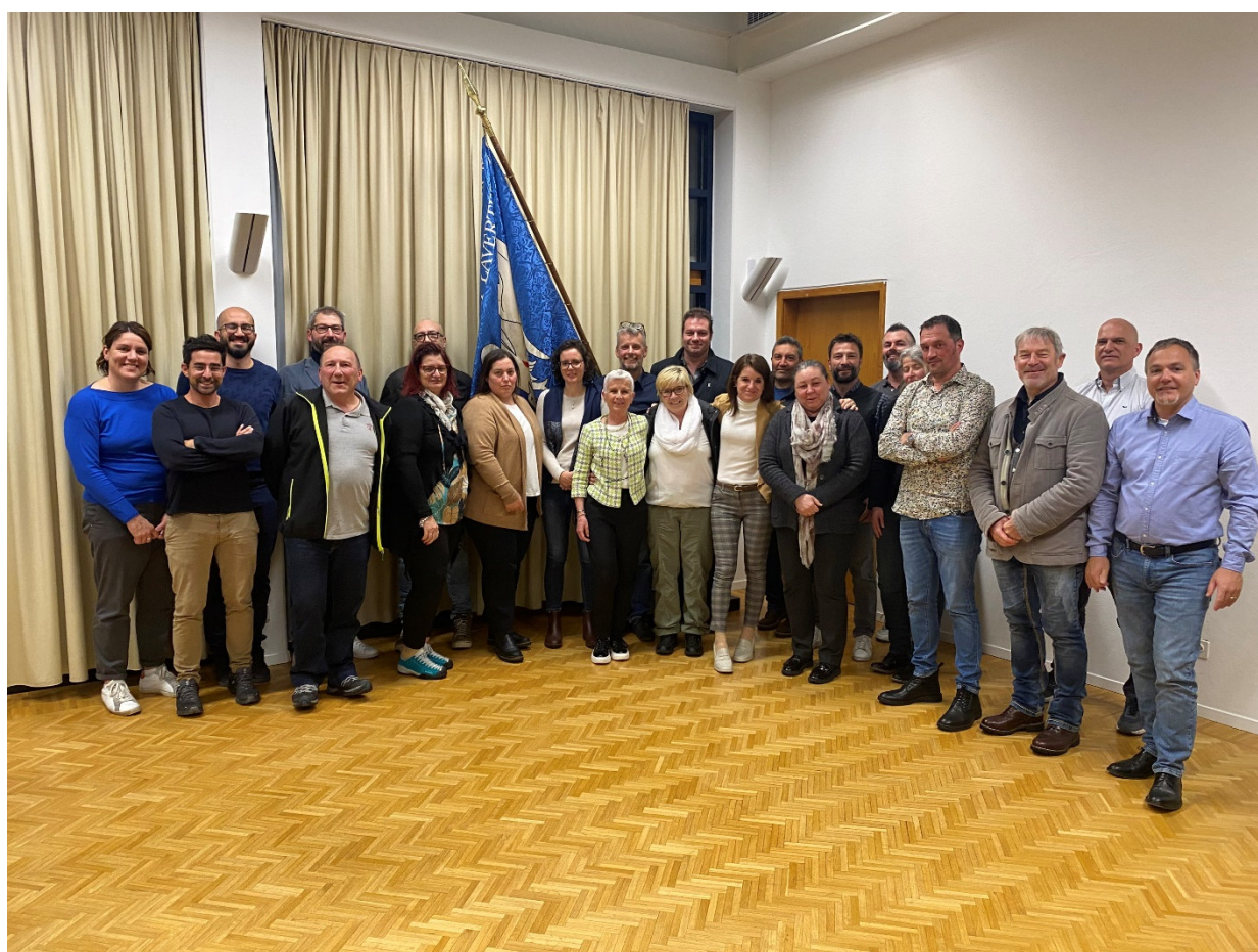
Foto di fine Legislatura